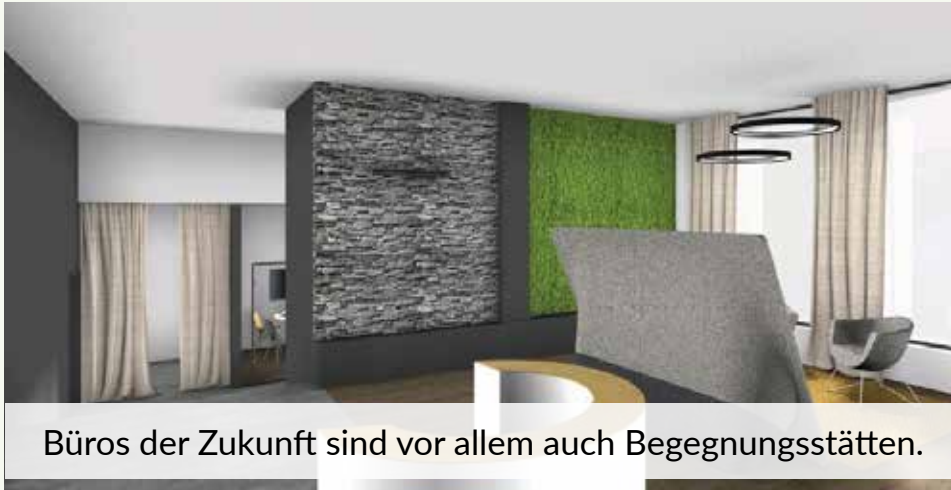
Büros der Zukunft sind vor allem auch Begegnungsstätten.