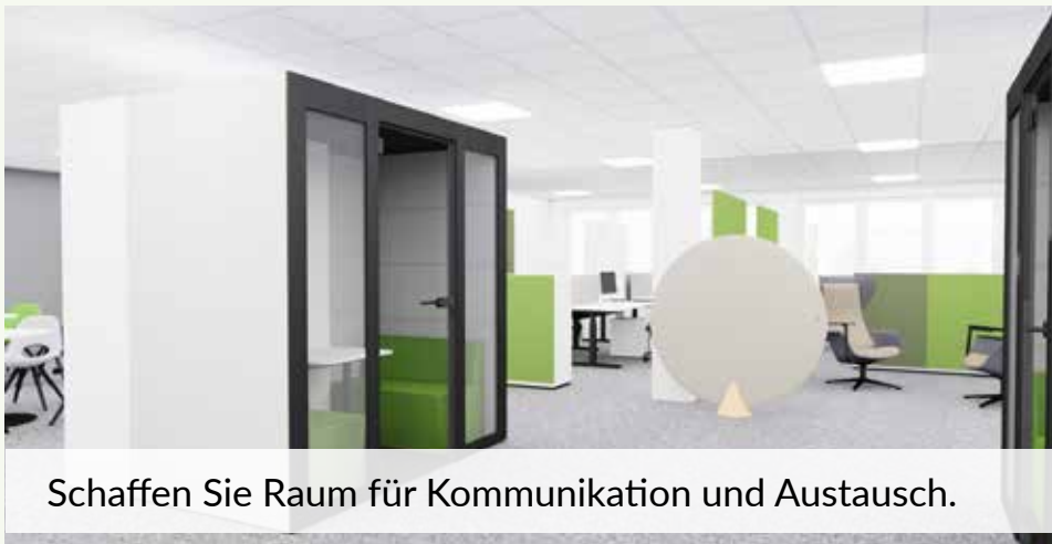
Schaffen Sie Raum für Kommunikation und Austausch.